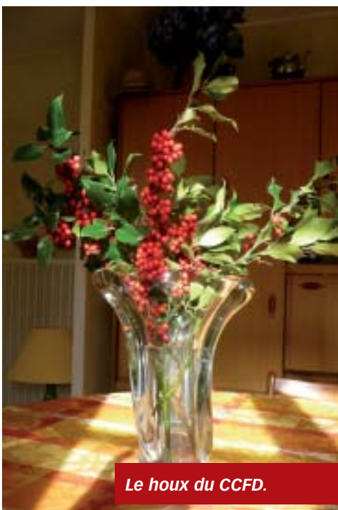
Le houx du CCFD.