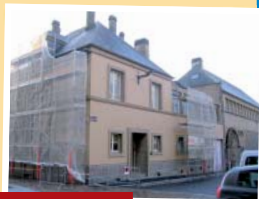
Cure de jouvence pour le presbytère.