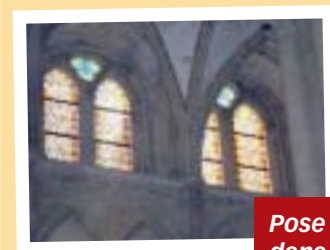
Pose de vitraux dans le chœur de la cathédrale.