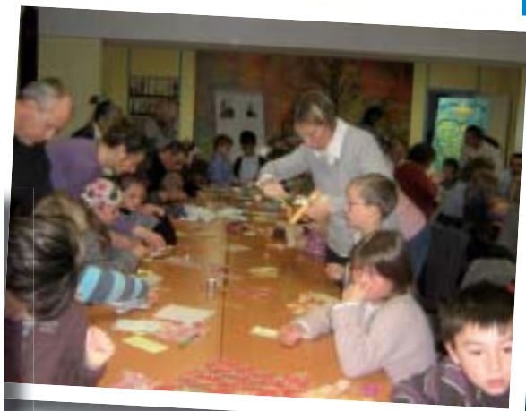
Parents et enfants au travail.