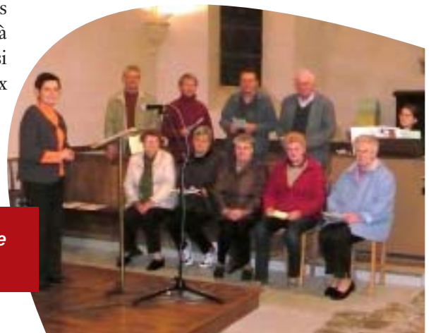
Chorale de la paroisse de Cambernon.