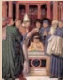
Saint Ambroise baptise Augustin

Né à Trèves vers 340, Ambroise fait ses études à Rome et devient avocat. Puis il est nommé gouverneur de la province de Milan.