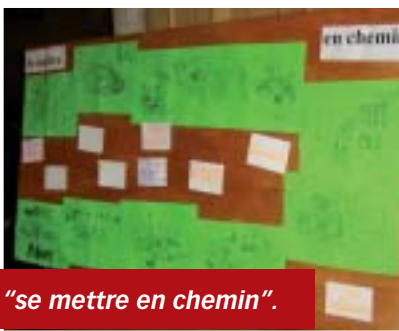
BD "se mettre en chemin".