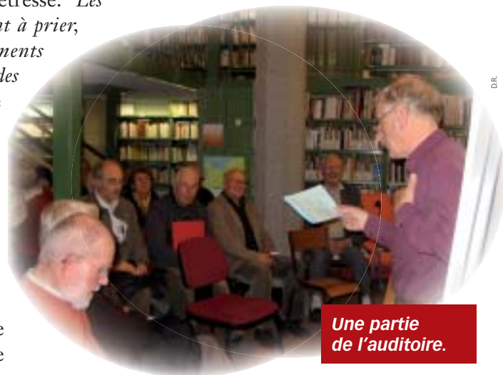
Une partie de l'auditoire.