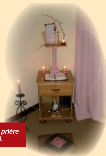
Un coin prière chez soi.

Pourquoi aussi ne pas décider chez soi d'un "coin prière" ?