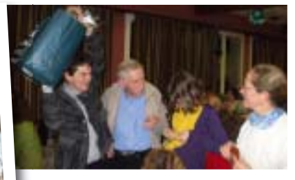
Grâce à l'équipe organisatrice, et à l'animation