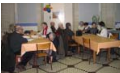
Deux des groupes de la soirée.

l'avant sans se laisser arrêter par les épreuves, alors que nous, nous sommes parfois craintifs et découragés ! Quel était donc son secret ? Il "vivait du Christ" et "priaient sans cesse" , affirme-t-il. Est-ce facile de prier ? Non, mais sans une prière habituelle, avons-nous reconnu, il est impossible de laisser se créer une relation personnelle avec le Christ, impossible de devenir son témoin vivant dans la vie de tous les jours. Quelqu'un a ajouté : "Et comment connaître le Christ sans la fréquentation habituelle de sa Parole ?"