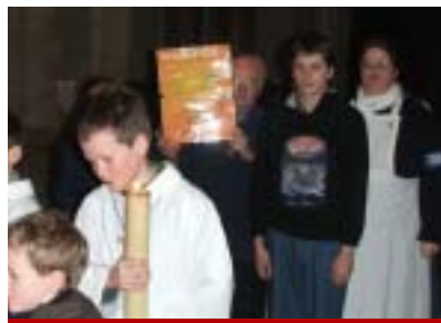
Procession célébration liturgique.

À Coutances, pour la première fois, les acteurs de la santé (Fraternité chrétienne des personnes malades, aumônerie des hôpitaux,