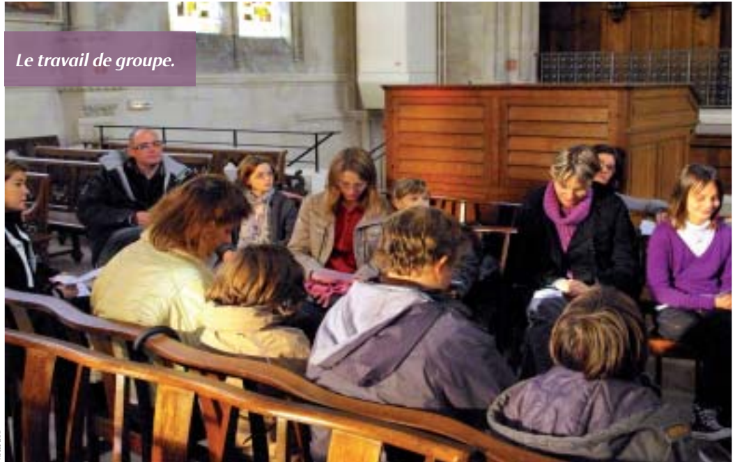
Le travail de groupe.

À 9h30, histoire de se réveiller, tout le monde s'est retrouvé comme de coutume autour du café, jus de fruit et gâteaux. Ensuite le père Huet a accueilli l'assemblée dans la chapelle du CAD avec le chant : "Je crois en Toi". Le passage d'un DVD sur le symbole des apôtres, c'est-à-dire le signe de croix qui permet aux chrétiens d'exprimer leur foi en Dieu, Fils et Saint Esprit a initié le travail de réflexion. Douze groupes ont alors été constitués pour réfléchir à la signification : Dieu Père - Dieu Fils - Dieu Saint Esprit.