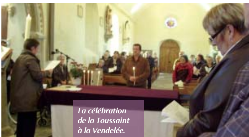
La célébration de la Toussaint à la Vendelée.