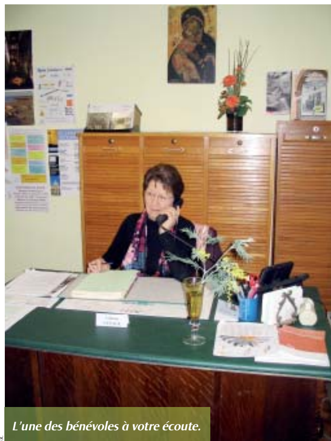
L'une des bénévoles à votre écoute.

- difficiles à satisfaire : des personnes dans le besoin viennent demander de l'aide matérielle. Dans ce cas, nous tâchons de les orienter vers le Secours catholique ou les services sociaux de la ville. Nous avons aussi parfois des demandes d'exorcisme qui sont traitées par une personne spécialisée vers laquelle nous les orientons. Beaucoup de gens sont perturbés et ont surtout besoin d'écoute.