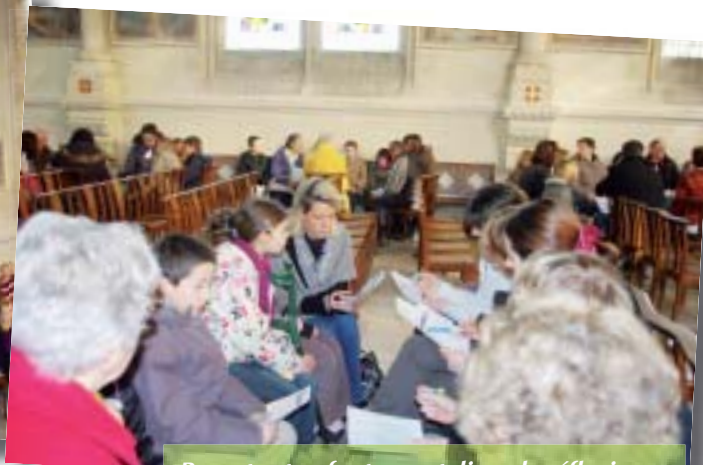
Parents et enfants en ateliers de réflexion.