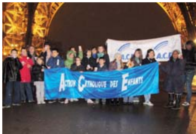
Le rassemblement sous la tour Eiffel.