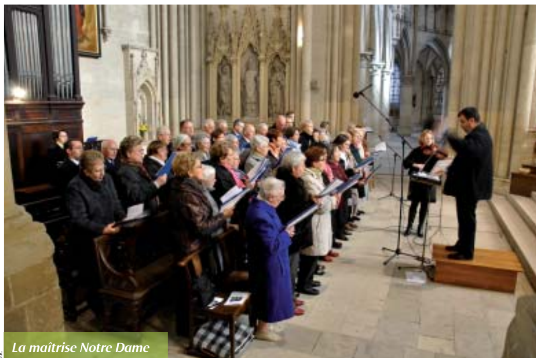
La maîtrise Notre Dame

La Maîtrise accompagne toutes les grandes fêtes liturgiques à la cathédrale.