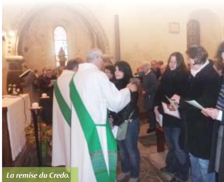
La remise du Credo.