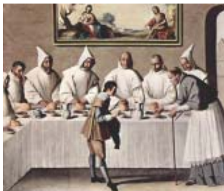
Francisco de Zurbarán, 1630-1635, Musée des Beaux-Arts, Seville

Saint Hugues (à droite) au réfectoire des Chartreux.