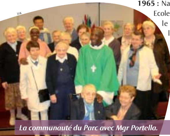
La communauté du Parc avec Mgr Portella.