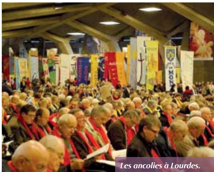
Les ancolies à Lourdes.