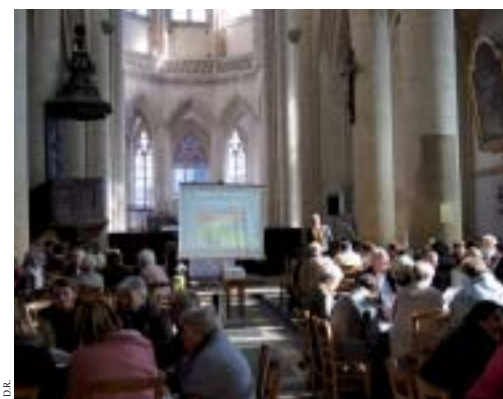
Temps d'échange lors de la journée catéchèse.