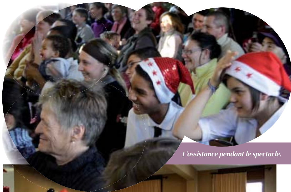
L'assistance pendant le spectacle.