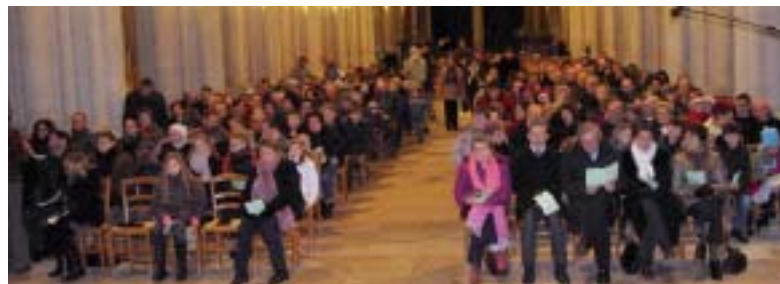
L'assemblée pendant la célébration.

L e 24 décembre à 18 h 30, à la cathédrale, les enfants accompagnés de leurs parents sont venus en grand nombre pour vivre la veillée de Noël. Une animation théâtrale sur le thème : "Noël, c'est nous" a été proposée à l'assemblée. Petits et grands ont ainsi été invités à