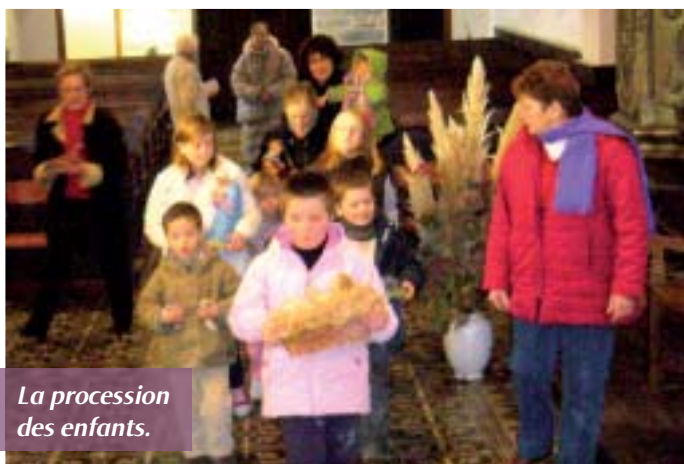
La procession des enfants.