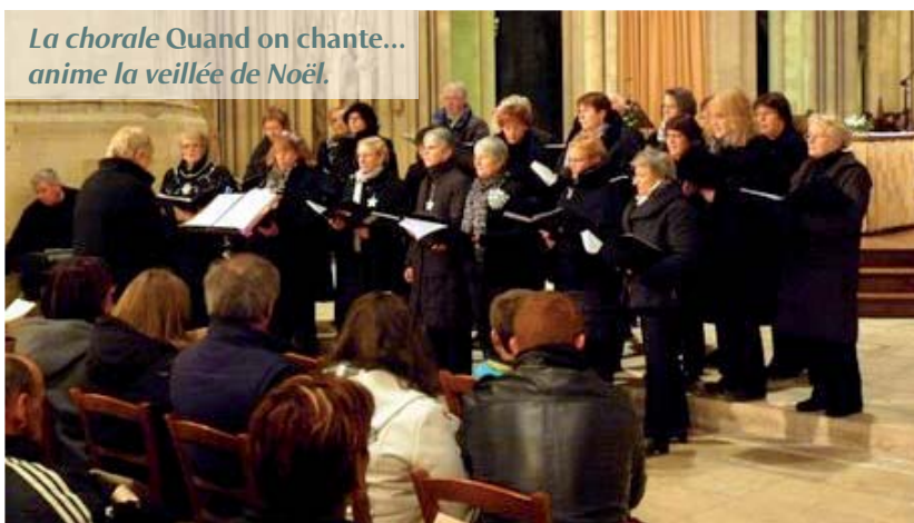
La chorale Quand on chante... anime la veillée de Noël.