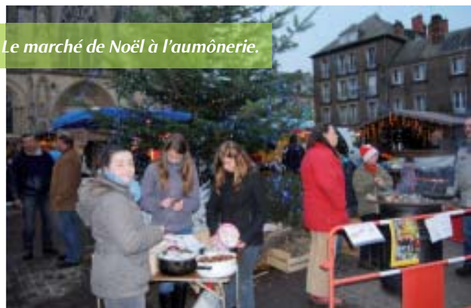
Le marché de Noël à l'aumônerie.