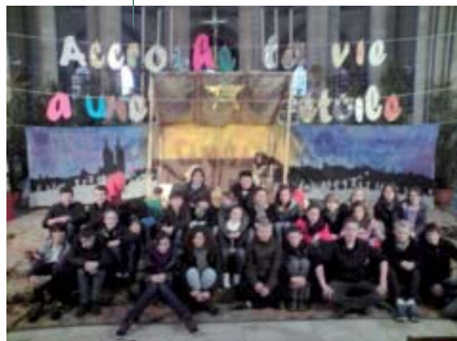
Les 3 es de Germain lors d'un temps fort caté avec un jeune de l'école de la foi.