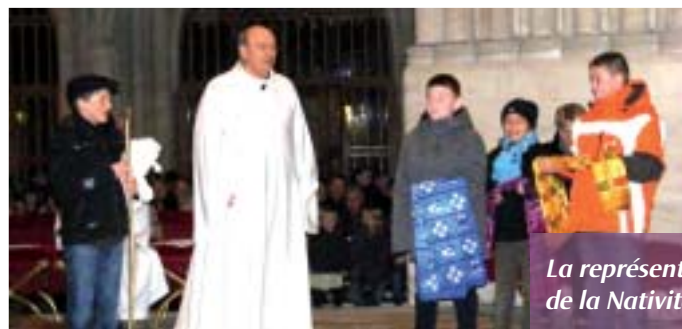
La représentation de la Nativité.