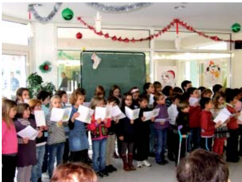
Les élèves de CE1 et CE2 de l'école Guérard chantent pour les personnes âgées au Noël de l'hôpital.

Les 3 es de Germain devant la crèche de la cathédrale qu'ils ont faite. En arrière-plan, la silhouette de la ville invite les habitants à accrocher leur vie à l'étoile-Jésus.