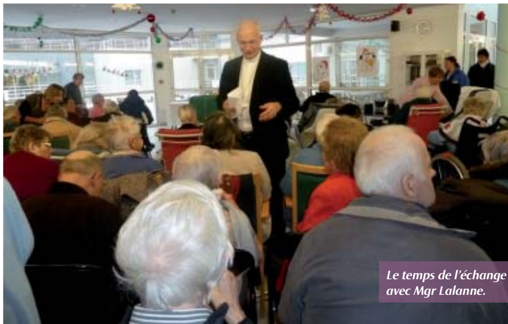
Le temps de l'échange avec Mgr Lalanne.

La réunion conviviale avec la dégustation des chouquettes et du jus d'orange a été chaleureuse.