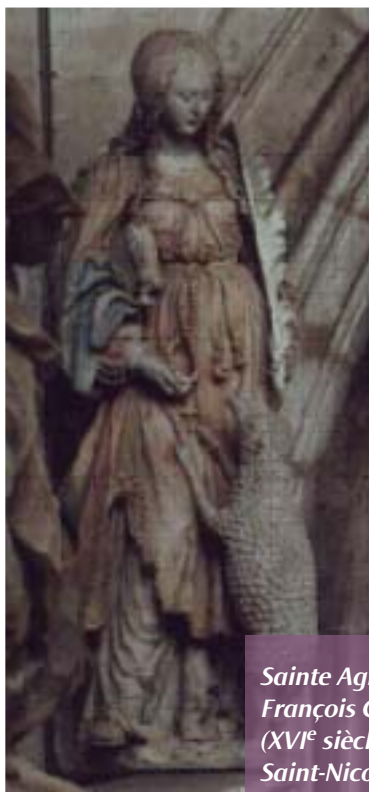
Sainte Agnès François Gentil (XVI e siècle), église Saint-Nicolas à Troyes.