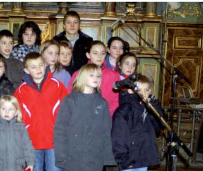
Le chœur des enfants.