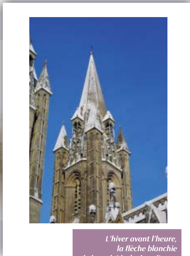
L'hiver avant l'heure, la flèche blanche de la cathédrale dans l'azur.