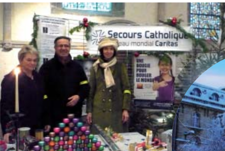
Le stand de Noël du Secours catholique à l'église Saint-Nicolas.