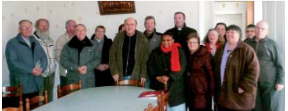
L'équipe d'animation du doyenné.

Il a donc entrepris de passer une dizaine de jours dans chacun des huit doyennés du diocèse. Le Pays Saint-Lois l'a accueilli en octobre, celui du Mortainais en novembre. Chez nous,