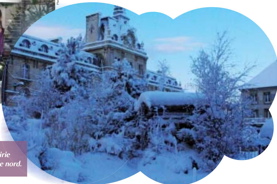
La mairie au pôle nord.