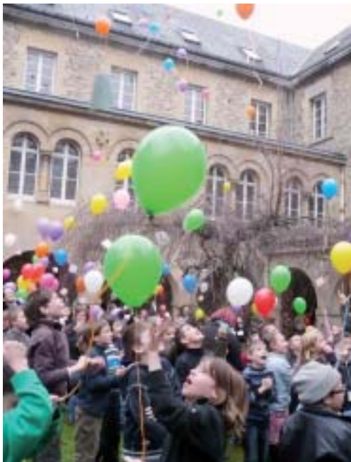
Le lâcher de ballon au terme de la journée consacrée aux enfants catéchisés.