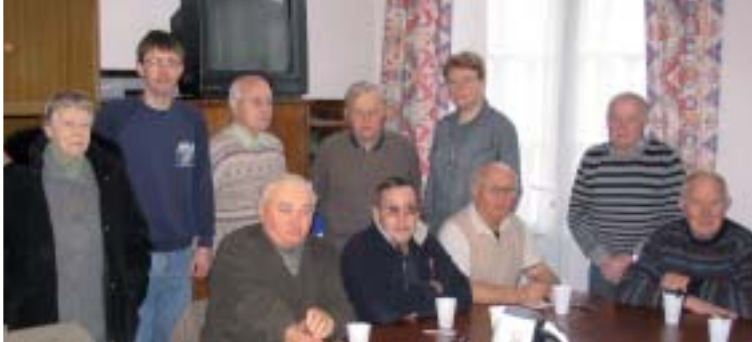
Pour préparer la visite de Mgr Lalanne, les sacristains de la paroisse ND de Coutances se sont réunis. Ils sont 20 à assurer un service d'Église: ouverture des églises rurales, préparation des célébrations, entretien...