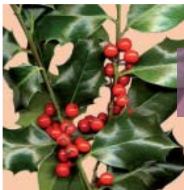
Le houx de la solidarité.

Les participants préparent actuellement le cinquantième anniversaire du CCFD-Terre Solidaire qui aura lieu au Parc des Expositions de Caen les samedi 26 et dimanche 27 mars pour tous les diocèses de Normandie.