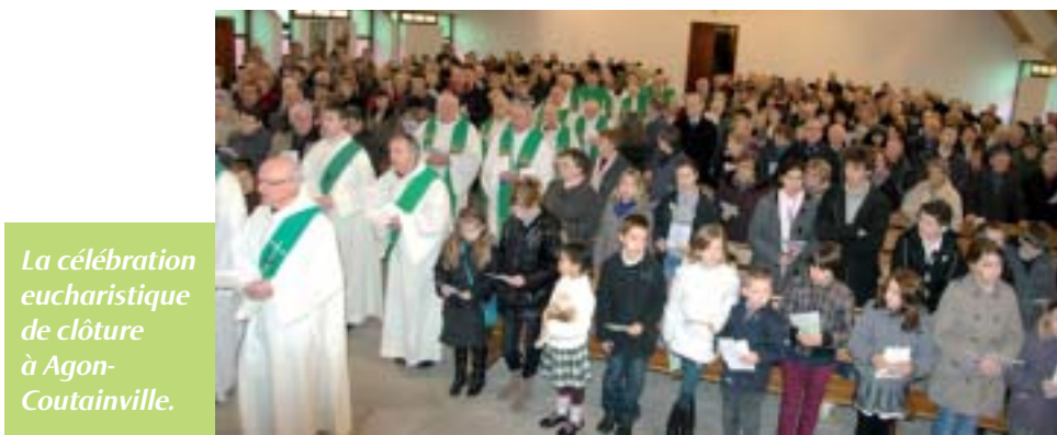
La célébration eucharistique de clôture à Agon-Coutainville.