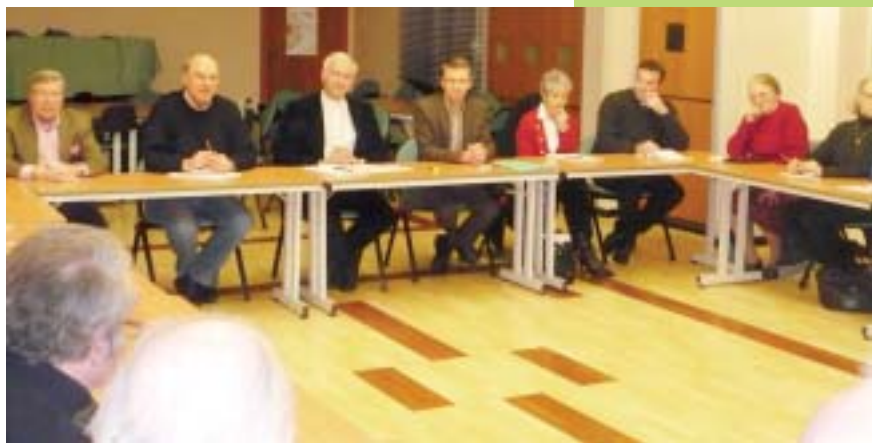
La rencontre avec les conseils économiques.