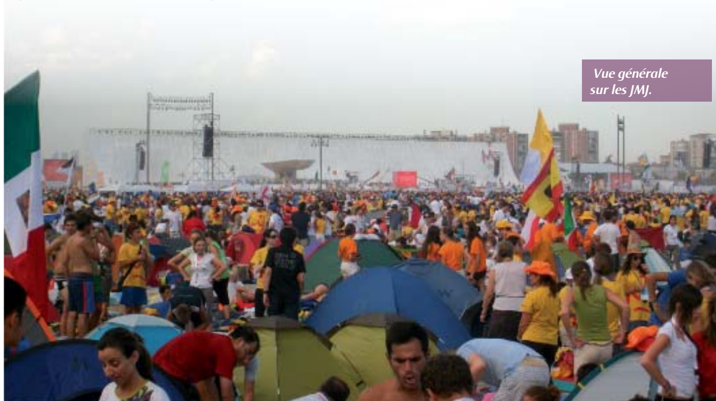
Vue générale sur les JMJ.

■ Anthony Fauvel, lycéen de l'aumônerie de l'enseignement public de Coutances