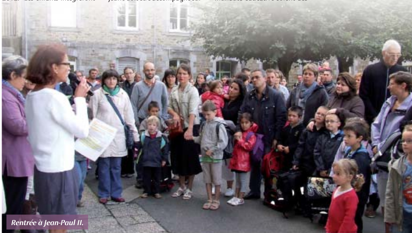
Rentrée à Jean-Paul II.