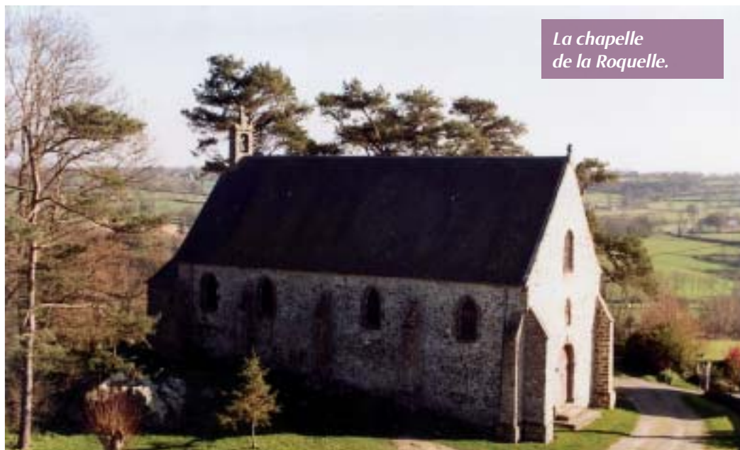
La chapelle de la Roquette.

Les membres souhaitent transmettre le flambeau afin de pérenniser le travail entrepris.