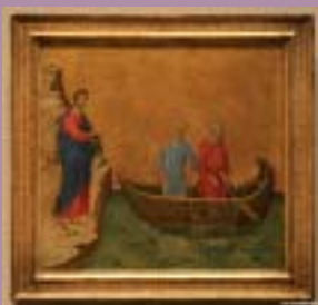
L'appel des apôtres Pierre et André (Duccio de Buoninsegna, National Gallery, USA).