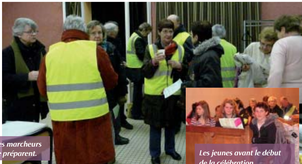
Les marcheurs se préparent.

V endredi 9 mars avait lieu à Bricqueville-la-Blouette la traditionnelle marche de Carême organisée par la paroisse. Après un circuit de quelques kilomètres dans la campagne, les participants se retrouvèrent dans l'église pour le sacrement de la Réconciliation. Un pique-nique festif dans la salle des fêtes termina cette belle soirée.