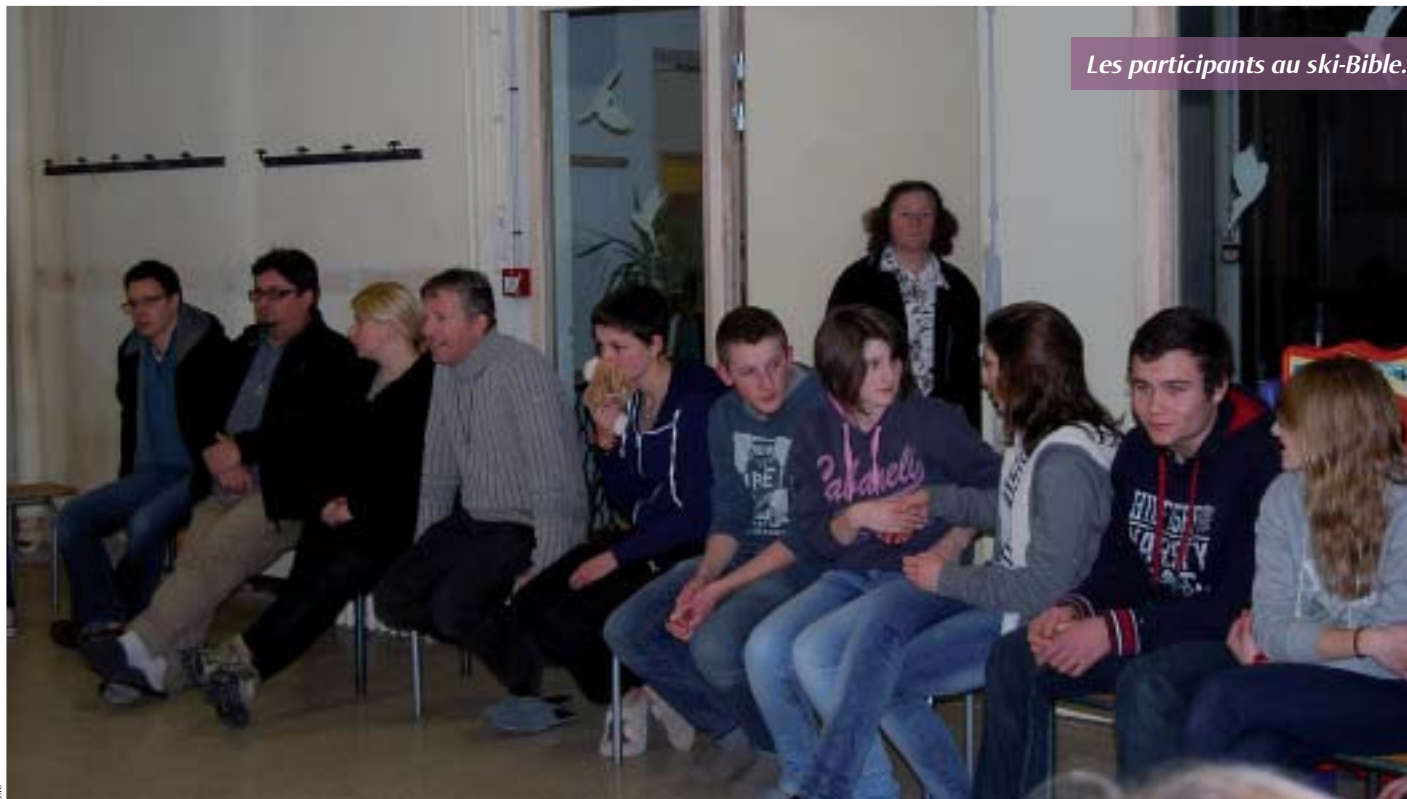
Les participants au ski-Bible.

Pour la vingtième année consécutive, les aumôneries scolaires de la Manche organisaient un camp ski-Bible dans les Hautes-Alpes. Camille, lycéenne à Coutances, nous a confié ses impressions.