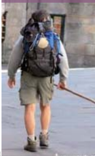
Sur la route vers Saint-Jacques-de-Compostelle.