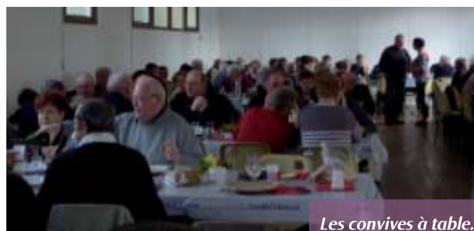
Les convives à table.

Malheureusement, quelques jours avant le repas, la voûte de la chapelle du Sacré-Coeur a été transpercée par une chute de pierres entraînant