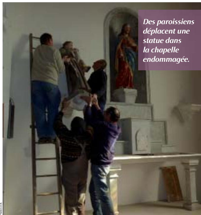
Des paroissiens déplacent une statue dans la chapelle endommagée.

la fermeture de l'édifice pendant un certain temps. Les paroissiens espèrent toutefois