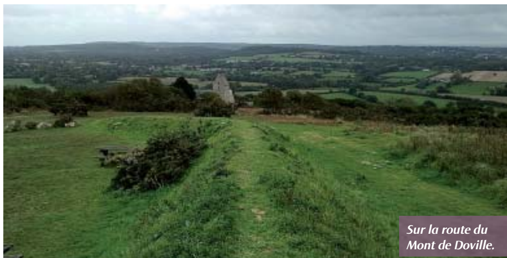
Sur la route du Mont de Doville.