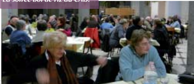
La soirée bol de riz au CAD.

des témoignages de bénévoles vincentiens de Paris ont permis à l'assemblée de découvrir les actions vécues dans la simplicité de la rencontre au nom du Christ et l'aide matérielle et financière auprès des plus démunis. Quant à la conférence Saint-Vincent-de-Paul Notre-Dame de Coutances, petite structure associative, elle a pu, par les quêtes et dons de particuliers, finaliser 14 dossiers de demandes d'aides, encourager et soutenir chaque personne visitée l'année passée. Les moments de convivialité ne sont pas très nombreux durant l'année paroissiale. La vie tré-