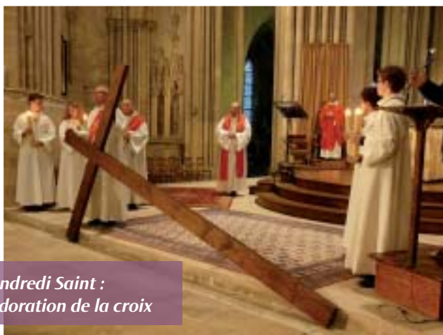
Vendredi Saint : l'adoration de la croix