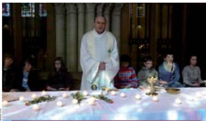
La célébration eucharistique de la première des communions en clôture du temps fort.