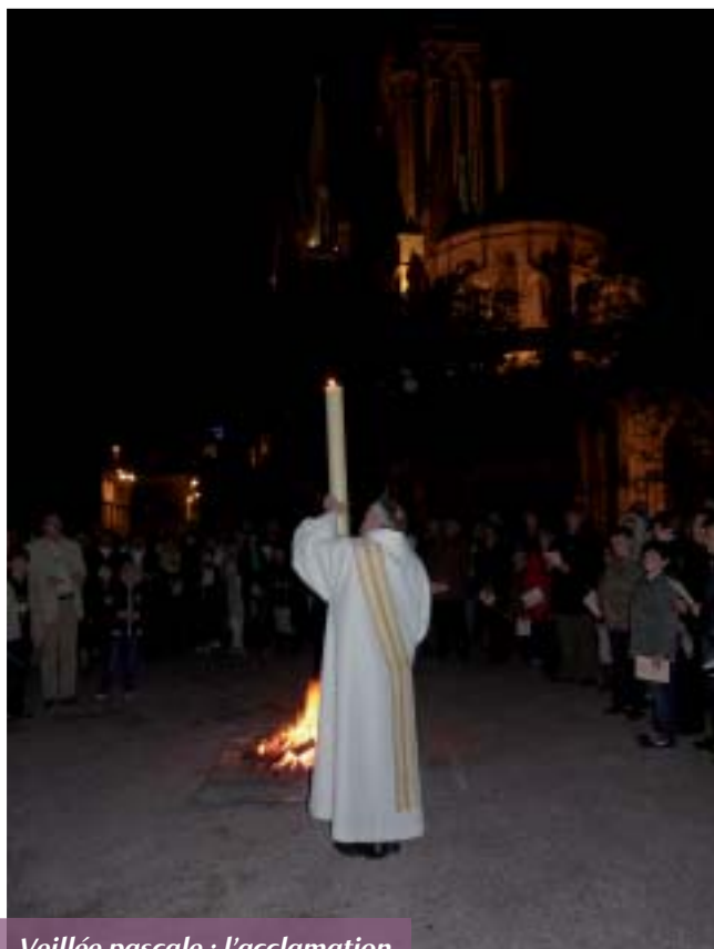
Veillée pascale : l'acclamation du Christ ressuscité.