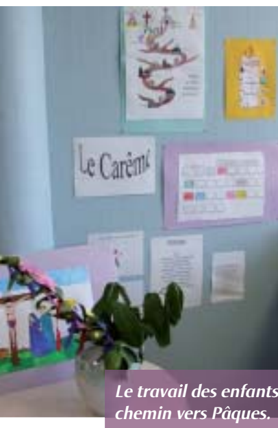
Le travail des enfants, chemin vers Pâques.

Chaque personne possède en elle des richesses et des talents que le découragement ou les difficultés ne doivent jamais éteindre. A chaque personne il appartient de faire éclore ses qualités.