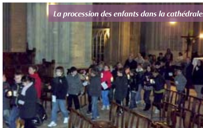
La procession des enfants dans la cathédrale.

Les classes de maternelles, CP et CE1 sont allées au CAD le jeudi 5 avril. La célébration a débuté dans le cloître avec un chant et l'écoute de l'Evangile des Rameaux. Toujours en chantant, les enfants se sont dirigés en procession vers la chapelle du CAD avec leurs branches de rameaux. Ils ont ensuite apporté