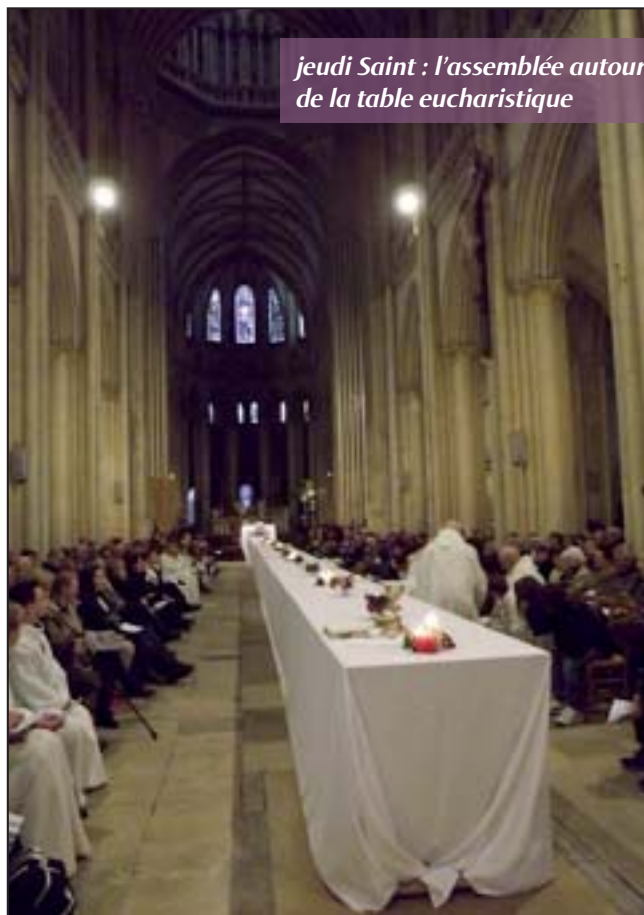
jeudi Saint : l'assemblée autour de la table eucharistique