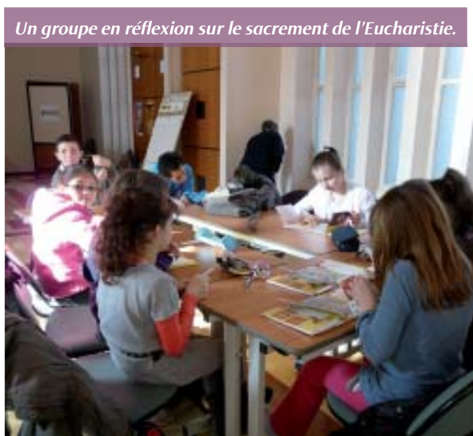
Un groupe en réflexion sur le sacrement de l'Eucharistie.