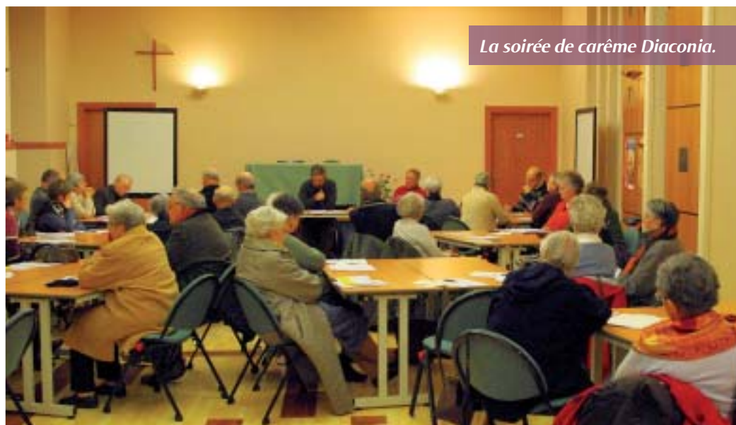
La soirée de carême Diaconia.