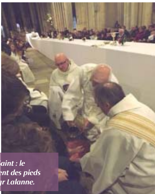
Jeudi Saint : le lavement des pieds par Mgr Lalanne.