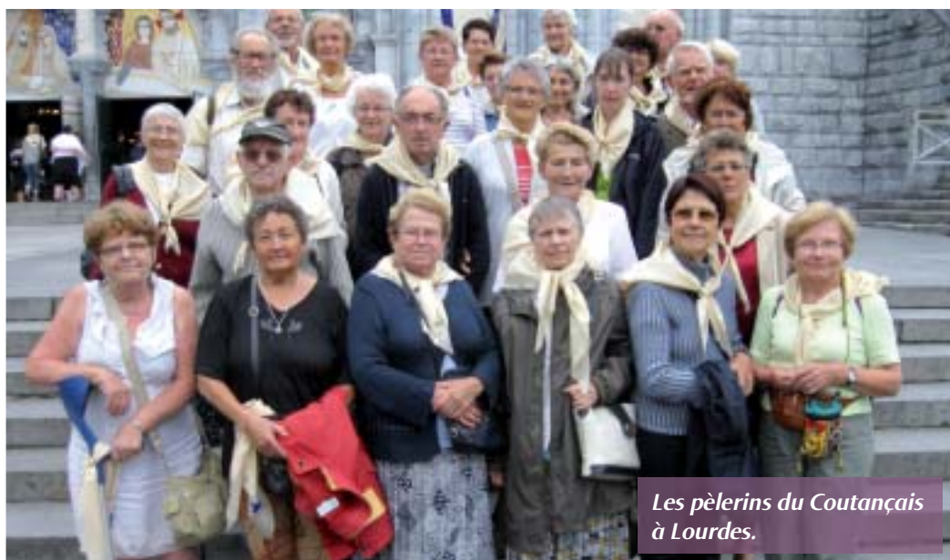
Les pèlerins du Coutançais à Lourdes.