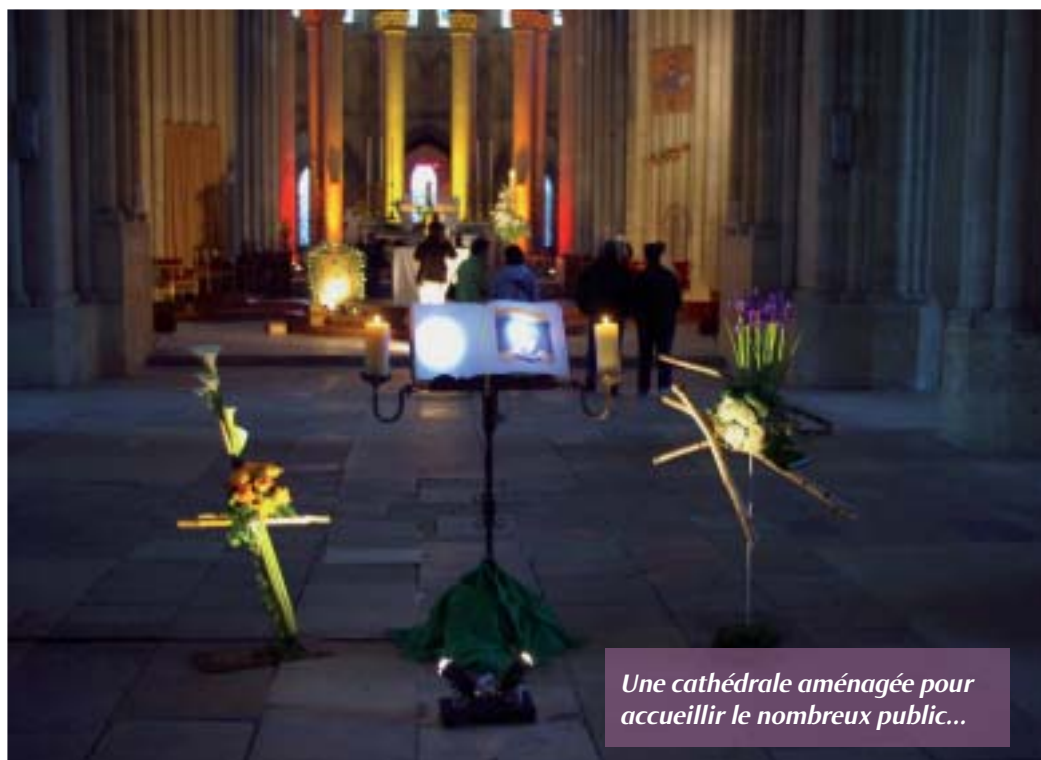
Une cathédrale aménagée pour accueillir le nombreux public...

Cette manifestation initiée par le Père F. Marécaille, la paroisse de Coutances, les Amis de la cathédrale n'est possible que grâce à la disponibilité d'une trentaine de personnes pour l'accueil,