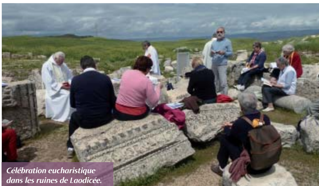
Célébration eucharistique dans les ruines de Laodicée.