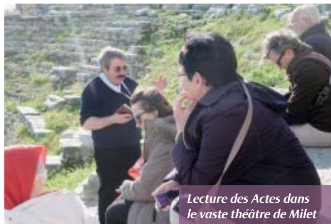
Lecture des Actes dans le vaste théâtre de Milet

de Laodicée (une des Sept églises de l'Apocalypse), de Colosses, de Milet, sans oublier Ephèse où nous "croisons" Saint-Jean, la Maison de la Vierge Marie et les pères du Concile de 431... La messe célébrée chaque jour nous amène à rencontrer des pasteurs et des communautés très peu nombreuses (cathédrale du Saint-Esprit à Istanbul, l'église Saint-Paul à Iconium,