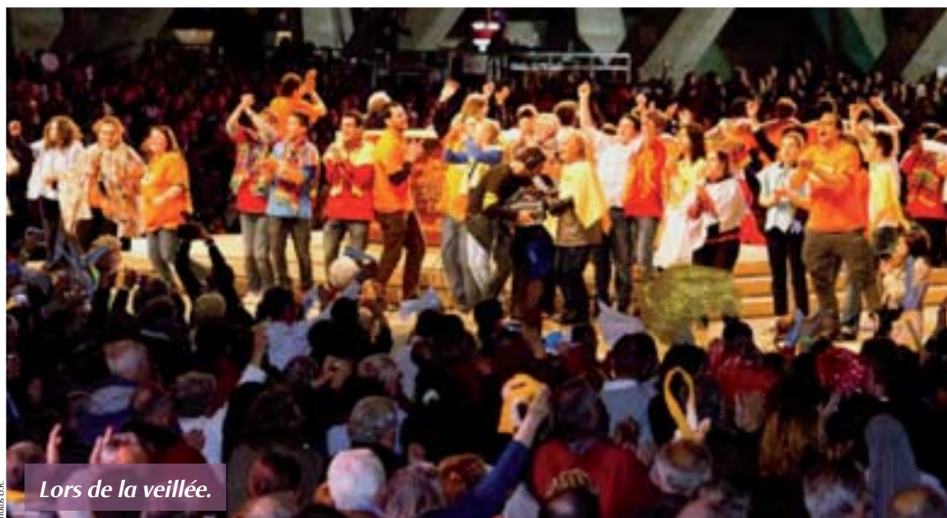
Lors de la veillée.

Organisés en groupes de six personnes chacun, nous avons fait une expérience forte et joyeuse de fraternité. Notre souhait est que cet esprit de fraternité évangélique irrigue plus fortement la vie de nos communautés et