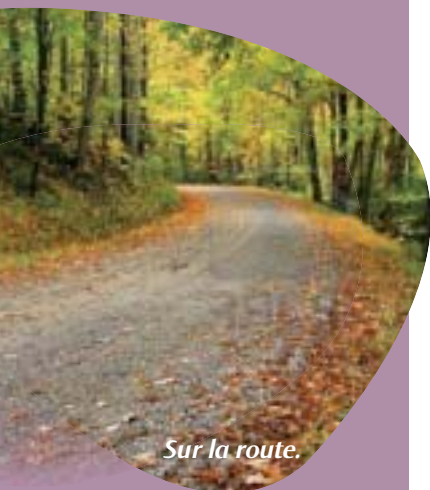
Sur la route.