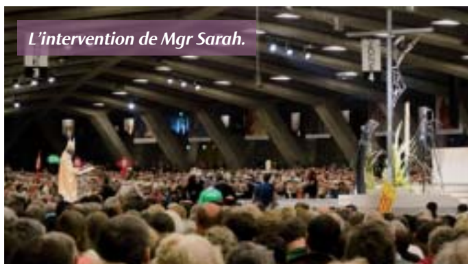
L'intervention de Mgr Sarah.