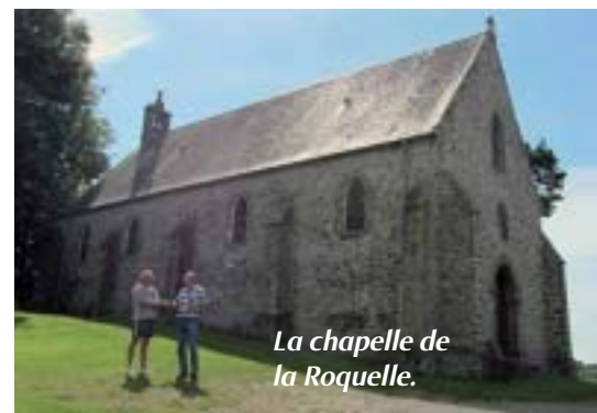
La chapelle de la Roquette.